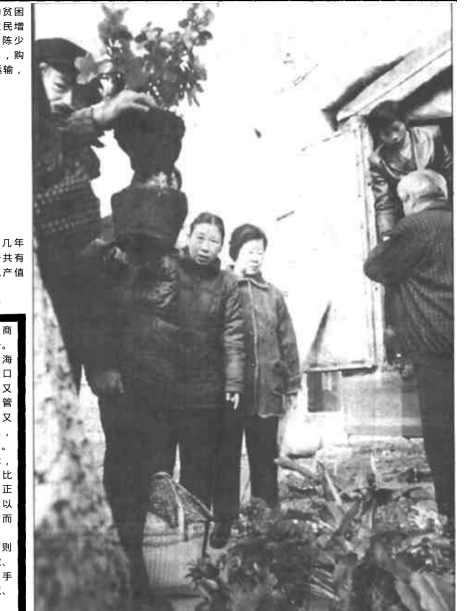
日前，在东营区的一些集市上，记者看到名花摊前，农民们在纷纷购买鲜花。据了解，如今农民的房子大了，家具新了，生活品位高了，买盆名花装点新居已不再是奢侈了。

成一村一业、多业并举的发展格局。全区每个乡镇都建起了各具特色的专业村，辛店镇的屠宰业、运输业，龙居乡的苇帘加工业等民营项目均已成为当地的主导产业，有力地带动了城乡经济的发展。(张保华 张成华)